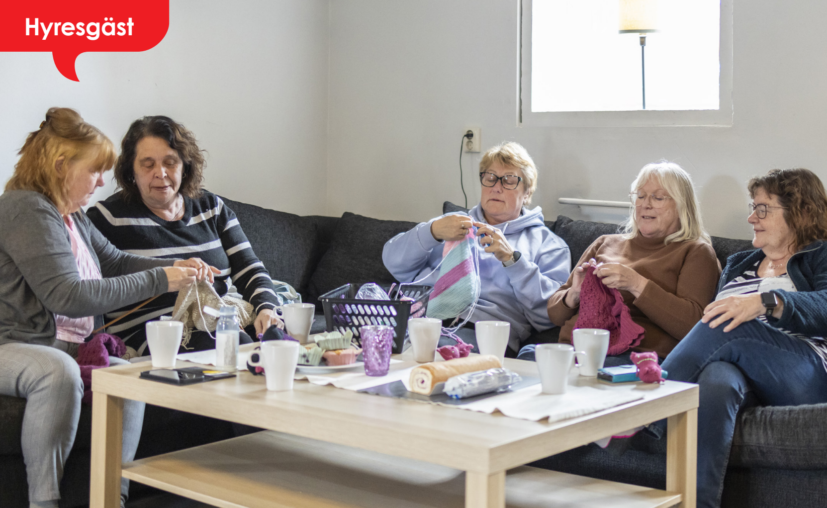
Flitiga fingrar, gott fika och många skratt – Veckopysset har blivit en av veckans mest uppskattade stunder.