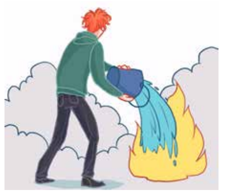
ትኸእል እንተ ኾይንካ፡ ነቲ ሓዊ ባዕልኻ ኣጥፍኣኛ።