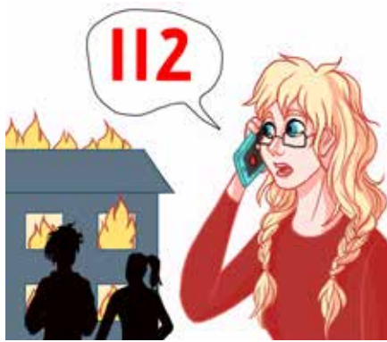
ናብ ቍጽሪ 112 ደዊልካ ብዛዕባ'ቲ ሓዊ ኣጠንቅቆ። ደዊልካ፡ እንታይ ከም ዘጋጠመ፡ ገለ ዝተጎደእ ሰባ እንተሎ፡ ሓገዝ ኣበይ ቦታ ከም ዘድሊ፡ ከምኡ'ውን መን ምዃንካ ሓብር።