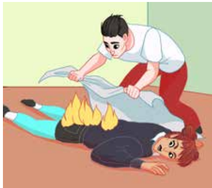
ናይ ገለ ሰባ ክጻን ኪነድድ ከሎ፡ እቲ ሰባ ኣብ መሬት ከም ዚጋደም ግበር። ነቲ ሓዊ በቲ ኮበርታ ወይ ካልእ ተመሳሳሊ ንርካ ዓፊንካ ኣጥፍኣዮ። ካብ ወገን ርእሲ ጀግርካ፡ ንታሕቲ ገጽካ ምጥፍእ ቀጽል።