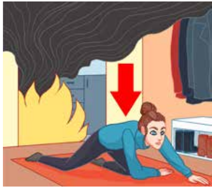
ነቲ ሐዊ ከተሞፍኦ ዘይትኸእል ኸይንኩ፣ ንደገ ውጻእ።

ቅድም ቀዳድም ኩሉ ሰብ ከም ዚወጽእ ግበር። ሐዊ ንዝኣተዎ ክፍሊ ወይ ገዛ ማዕጾኡ ዕጾዎ። ከምኡ ምግባር ነቲ ሐውን ትኩን ንኸይለባዕ ደው የብሉ።