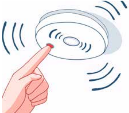
ንመጠንቀቂ ሓዊ፡ መፈተኒኡ እንዳ ጸቐጥካ፡ ዚሰርሕን ዘይሰርሕን ንምፍላግ ወርሒ - ወርሒ ፈትኖ።