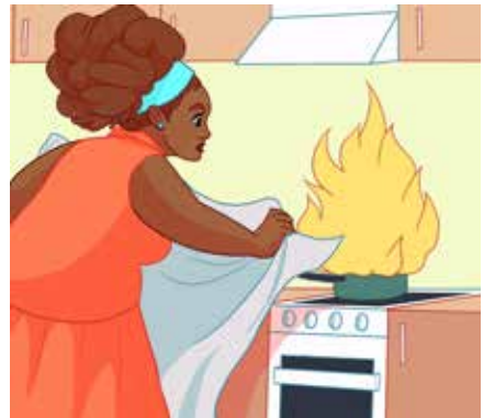
ነቲ ሓዊ በቲ ኮቦርታ ሓዊ ዓፍኖ፤ ነቲ ሓዊ ጠቢቕ ከም ዚኸድኖ ግበር፤ በእዳውካ ብጥንቃቄ ጸቐጦ።