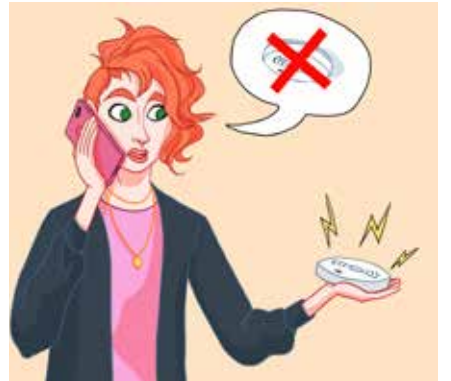
እቲ ባተሪ ምስ'ቲ መጠንቀቂ መሳርሒ ልጉብ'የ፤ ንዓሰርተ ዓመት ከላ ይላክል። እቲ መጠንቀቂ ሓዊ ፈቲንካፍ ዘይሰርሕ እንተ ኾይኑ፡ ምስ ናይ ከባቢ ሓላፊ ርክብ ግበር።