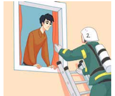
ክትወጽእ ኣገልግሎት ምድሓን ኪሕግዘካ ይኸእል።