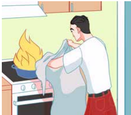
ኣብ ድሰቲ ባርዕ ሓዊ ኣብ ዚለዓለሉ ግዜ፡ በቲ መኽደኒኡ ከዲንካ ወይ ብኸኮበርታ ሓዊ ዓፊንካ ኣጥፍኣዮ። ኣብ መሰኽተቲ እቶን ሓዊ እንተ ተላዒሎ፡ ከተጥፍኦ ፈጸምካ ማይ ኣይትጠቐም። እቲ ማይ፡ ነቲ ሓዊ ናብ ካልእ ከም ዚለባዕ ይገብር።