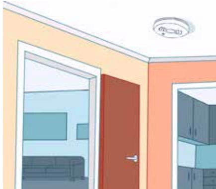
እቲ መጠንቀቂ ሓዊ ኣብ ናሕሲ ይለግብ።

ሓዊ እንተ ተላሂሎ፡ መጠንቀቂ ሓዊ ቀልጢፉ የጠንቅቅካ። ሸቡ ነቲ ሓዊ ከተጥፍ ወይ ንደገ ከትወጽእ ግዜ ትረከብ።