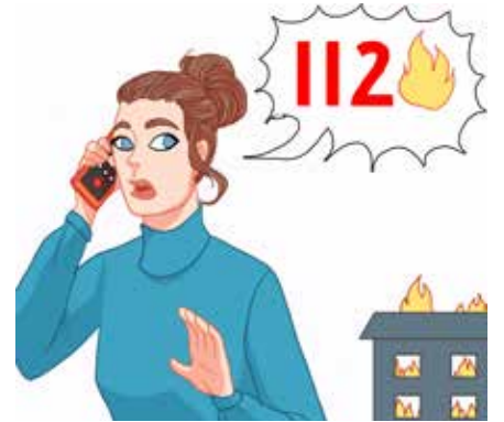
ናብ ቍጽሪ 112 ደዊልካ ብዛዕባ'ቲ ሐዊ ኣበንቅቕ።