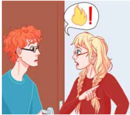
ኣብ ሓደጋ ኪህልዉ ንዚኸእሉ ካልኣት ሰባት ኣድሕኛም፤ ኣጠንቅቆም።

1. ኣድሕን፡ 2. ኣጠንቅቅ፡ 3. ኣፍልጥ፡ 4. ሓዊ ኣጥፍእ፡ ሓዊ ከም ዝተላዕለ እንተ ፈሊጥካ፡ ነዚኣተን ብተርታ ኣብ ግብሪ ኣውዕለን፡ ስሕት ኢሉ ግን፡ ነቲ ዘድሊ ነገር፡ ብኸልእ ኣሰራርዓ ክትፍጽም ዝሓሸ ኪኸውን ይኸእል'ዩ፡ ቍጽርኹም ሓይለ እንተ ኾይኑ ክትተሓጋዝቱ ትኸእሎ።