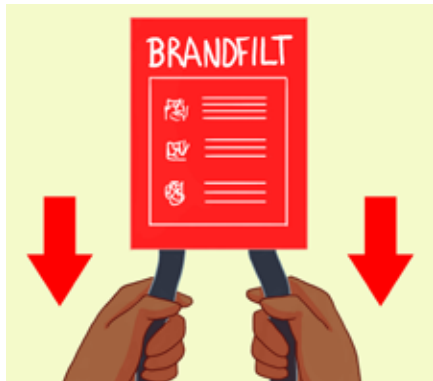
ነተን ክልተ ገመዳት ሰሓብካ ነቲ ኮቦርታ ሓዊ ኣውጽእ።