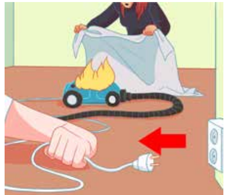
ኣብ መባርሕታት ኤለክትሪክ ሓዊ እንተ ተላዒሎ፡ - ፈለማ ነቲ ገመድ ካብ መስኩዒ ስሒብካ ኣውጽኣዮ። ነቲ ሓዊ ብኮበርታ ወይ ብማይ ዓፊንካ ኣጥፍኣዮ። መጥፍኢ ሓዊ (pulversläckare) እንተ ረኺብካ፡ ነቲ ገመድ ካብ መስኩዒ ከየውጸእካ ከተጥፍኦ ትኸእል ኢኻ።