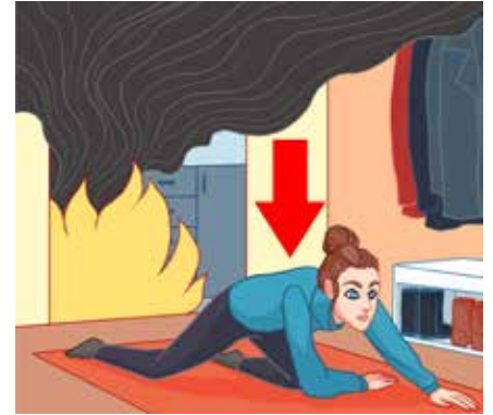
اگر قادر به خاموش کردن آتش نیستید بایستی بیرون بروید.