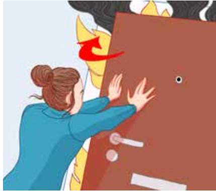
درب جایی که آتش گرفته را ببندید.