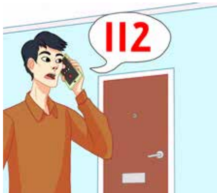
درب را بسته نگهدارید. برای اطلاع دادن آتشسوزی به شماره 112 زنگ بزنید.