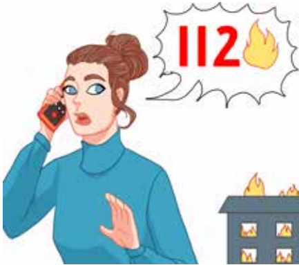
برای اطلاع دادن آتشسوزی به شماره 112 زنگ بزنید.

اول کاری کنید که همه بیرون بیایند. درب اتاق یا آپارتمانی که در آن آتشسوزی شده را ببندید. اینکار باعث می شود آتش و دود شیوع پیدا نکند.