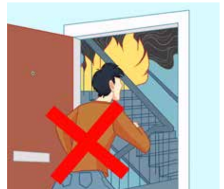
اگر خانه دیگری آتش گرفته باشد و راهرو پلکان دود وجود داشته باشد نباید از آپارتمان بیرون بروید.