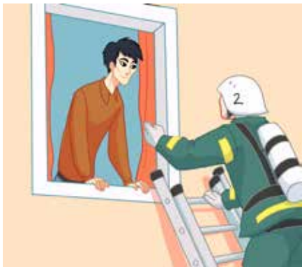
اگر لازم باشد بیرون بیایید، سازمان امداد و نجات به شما کمک می کند.

اگر بیرون آتشسوزی شده باشد، درب آپارتمان حدود 30 دقیقه بدون اینکه آتش بگیرد دوام می آورد. هرگز به راهرو پلکان پُر از دود بیرون نروید. هنگام آتشسوزی از آسانسور استفاده نکنید.